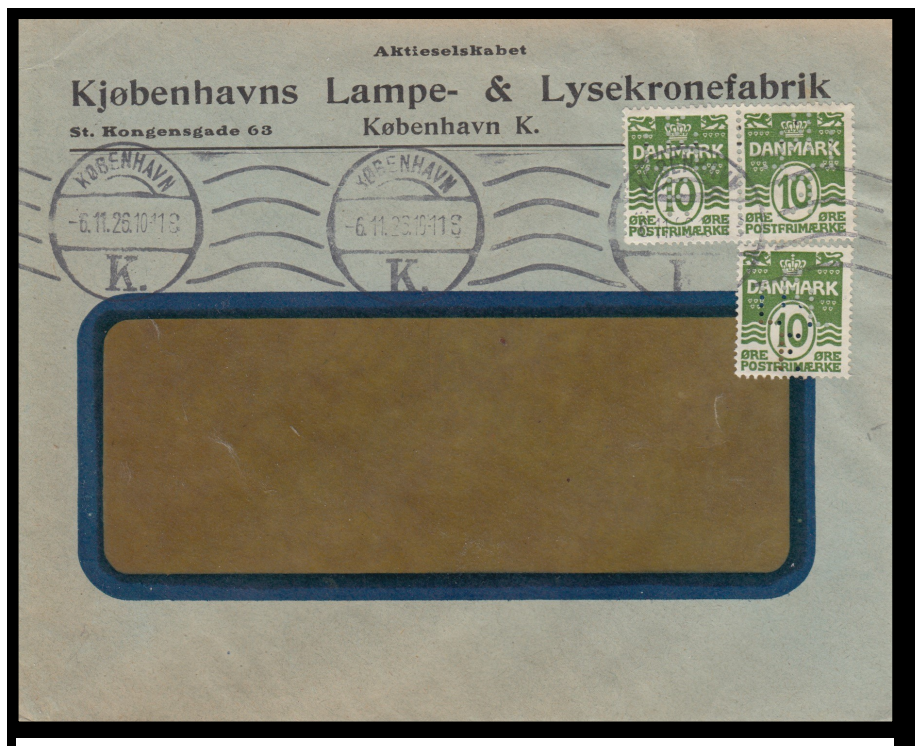
Brevet er korekt frankeret med 30 øre, som var taksten til UPU lande på den tid.

Efter at være stået op kl. 4.00, kørt næsten 700 km til frimærkemesse, lykkedes det næsten med det samme, med hjælp fra en god samleren, at finde nedenstående brev. Brevet fjerner et spørgsmålstegn i Perfin kataloget vedr. Kjøbenhavns Lampe- & Lysekronefabrik og rykker samtidigt tidligst kendte dato for brugen til 06.11.1926