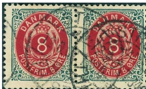
Struer-Thisted 12.09.02.