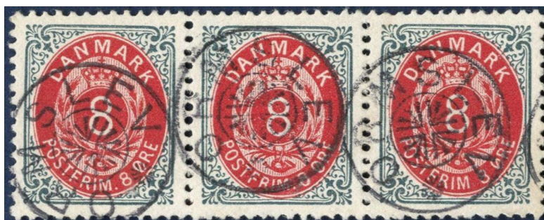
Ormslev her ved Aarhus.

Det er da immervæk umagen værd at ofre lidt tid på at lede. Katalogprisen i AFA er 3.800,- kr. for et stemplet mærke og smukke eksemplarer handles på auktioner til mellem 1.200,- og 2.000,- kr. På brev er vi oppe i de højere luftlag (AFA 22.000,- kr.).