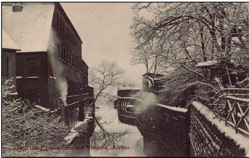
Aarhus, ved Frederiksbro, ved Vintertid, Aarhus

disse herreder; man hører flere gange om, hvordan den sydlige halvdel af broen vedligeholdtes for Ning Herreds brokorn.